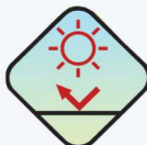
ทนทานต่อ UV